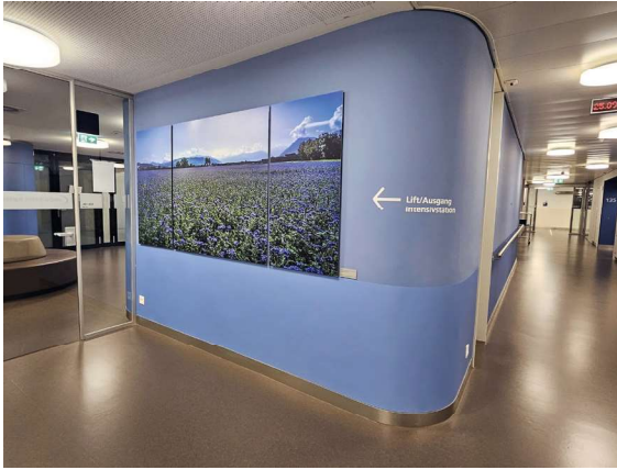
Acrovyn® by Design im Erdgeschoss