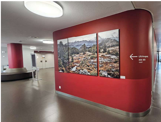
Acrovyn® by Design im 3. Obergeschoss