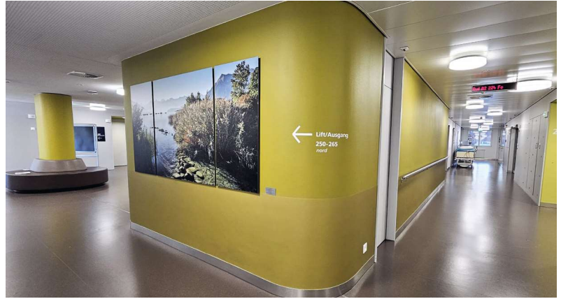
Acrovyn® by Design im 2. Obergeschoss